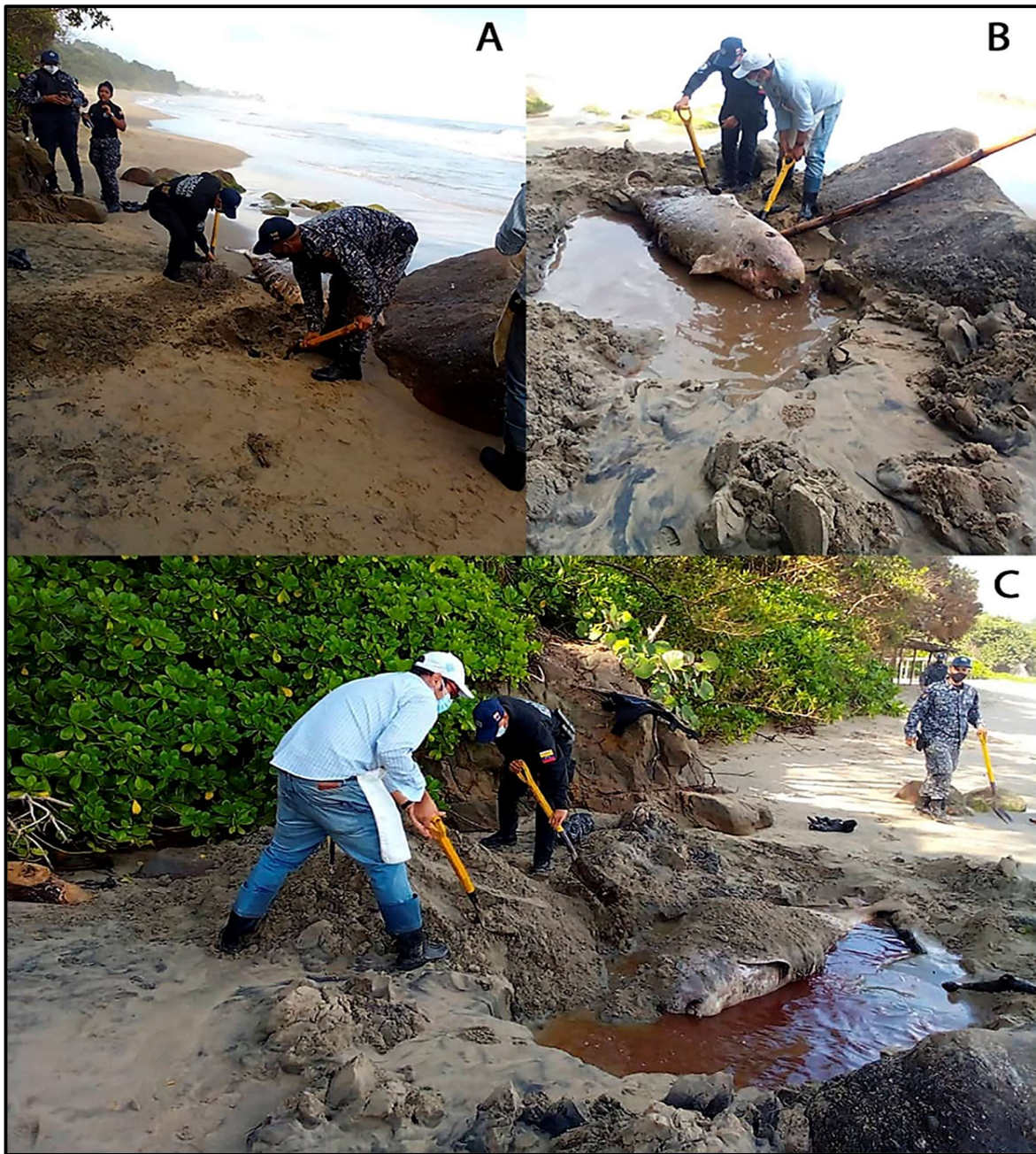
Figura 6. Excavación de la fosa para enterrar el cadáver y cubrimiento de los residuos con arena, como medida sanitaria de manejo de los desechos y control de un posible foco de infección. La actividad se llevó a cabo gracias a la colaboración de la Policía Nacional Bolivariana junto a la comunidad de pescadores del Consejo Comunal de Caruao, pertenecientes todos al estado La Guaira.