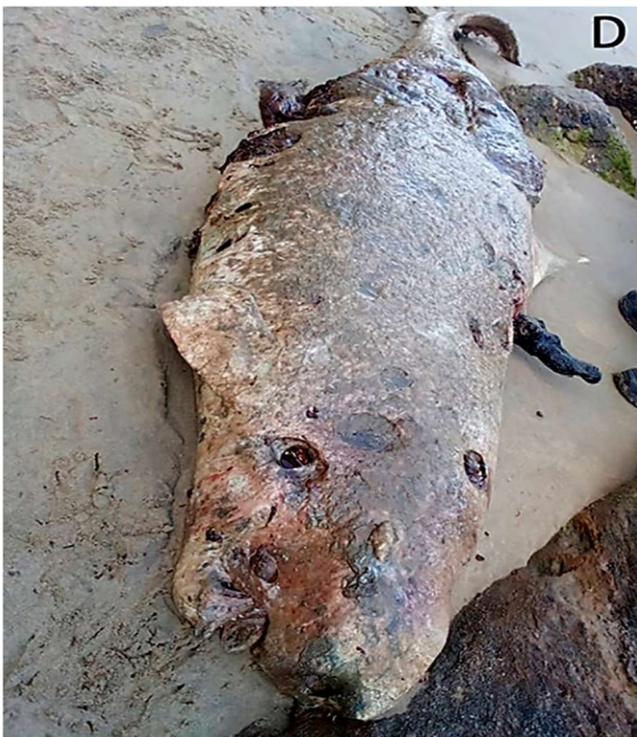
Figura 3 C y 3D. Registro fotográfico in situ del ejemplar de K. sima . La imagen C fue tomada días antes del operativo. Pueden apreciarse a un pescador de la zona que intenta trasladarlo fuera de la playa (C). Para el momento de su identificación y estudio biométrico, el cuerpo mostraba signos avanzados de descomposición (D).