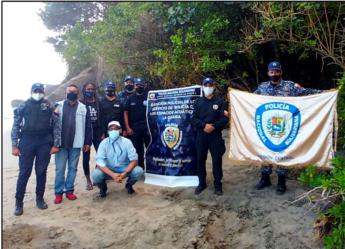
Figura 7. Integrantes del equipo que atendió el incidente de varamiento ocurrido en playa Juan Machi. Miércoles, 8 de diciembre de 2021.