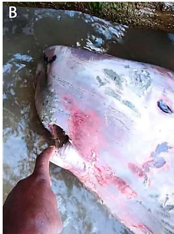
Figuras 3 A y 3B. Registro fotográfico in situ del ejemplar de K. sima . Las imágenes A y B fueron tomadas días antes del operativo. Pueden apreciarse ampollas y áreas edematizadas en la piel (A), ocasionadas por una prolongada exposición al sol. Un pescador de la zona examina la boca (B).