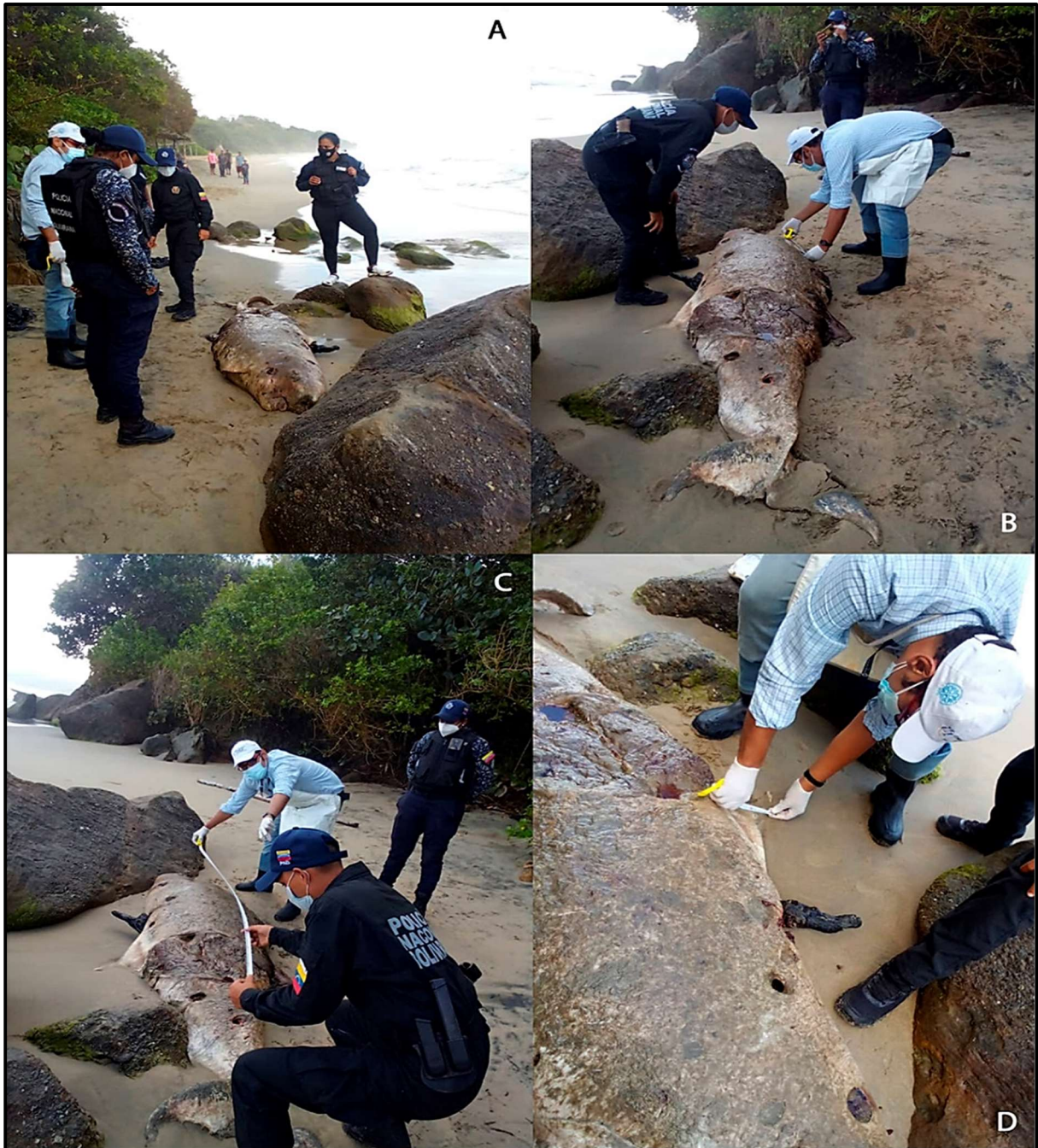
Figura 5. Identificación, reconocimiento y obtención de las medidas morfométricas. El ejemplar fue sujeto a una exhaustiva revisión ocular, observándose autólisis en los tejidos blandos (piel y vísceras), así como varias lesiones profundas ocasionadas por carroñeros (presumiblemente zamuros o aves acuáticas).