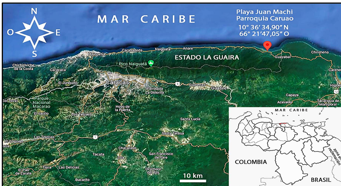
Figura 2. Ubicación de la localidad del varamiento [Modificado de Google Maps, 2022].

El lunes 6 de diciembre de 2021, un ejemplar varado de K. sima , fue encontrado en la playa Juan Machi de la parroquia Caruao, municipio Vargas, estado La Guaira, Latitud N 10° 36' 34,90" y Longitud O 66° 21' 47,05" (Figura 2). En las imágenes registradas al momento del hallazgo (Figuras 3A, 3B, 3C y 3D), se pudo apreciar con detalle que sus proporciones corporales son similares al cachalote ( Physeter macrocephalus ), aunque su tamaño es mucho más pequeño. Su cabeza es cuadrangular y la mandíbula es retraída con relación al maxilar, dándole la apariencia de un «tiburón». El 8 de diciembre de 2021 se realizó el operativo de inspección para estudiar al ejemplar, el cual, debido a su avanzado estado de descomposición (Figura 3D), tuvo que ser enterrado tan pronto culminó el trabajo de reconocimiento.