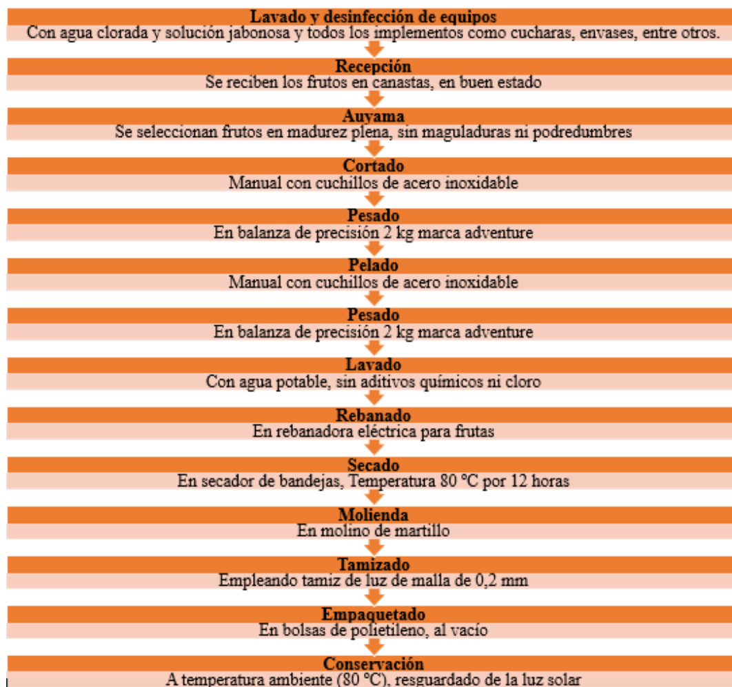
Figura 1. Esquema tecnológico de elaboración de harina de auyama.