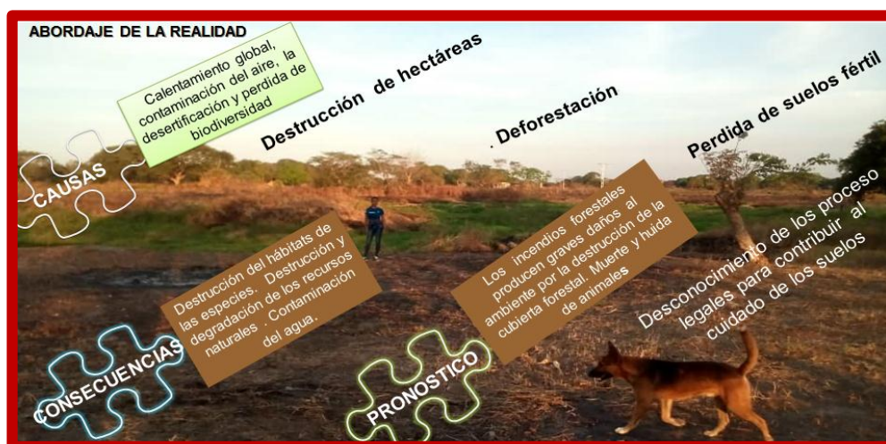
Figura 1. Abordaje de la Realidad

En tercer lugar, luego de ubicada la información en las hojas de análisis a través de la categorización y subcategorización descrita anteriormente se pasó al cuarto paso como es la interpretación y análisis de la información lo que dio base para emitir las opiniones de la autora, procediéndose de esta forma a elaborar un borrador del estudio. Después, se procedió a elaborar los gráficos que visualizan los contenidos, para luego escribir el análisis y resultado, que a continuación se especifica: